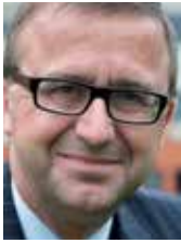
Bruno Segers Flanders Investment & Trade