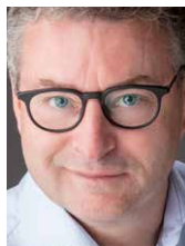
Koen Van den Heuvel Vlaams Minister