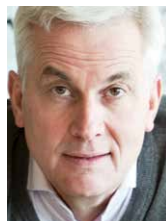
Thomas Rau Rau Architects