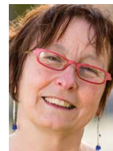
Tine Heyse Stad Gent