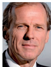
Allard Castelein Port of Rotterdam