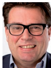
Hanno Reeser H. Essers Logistics