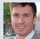
Wilfred Heijblom Advies